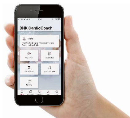
Abb. 1-- Die App BNK CardioCoach unterstützt Patienten mit Herzinsuffizienz.