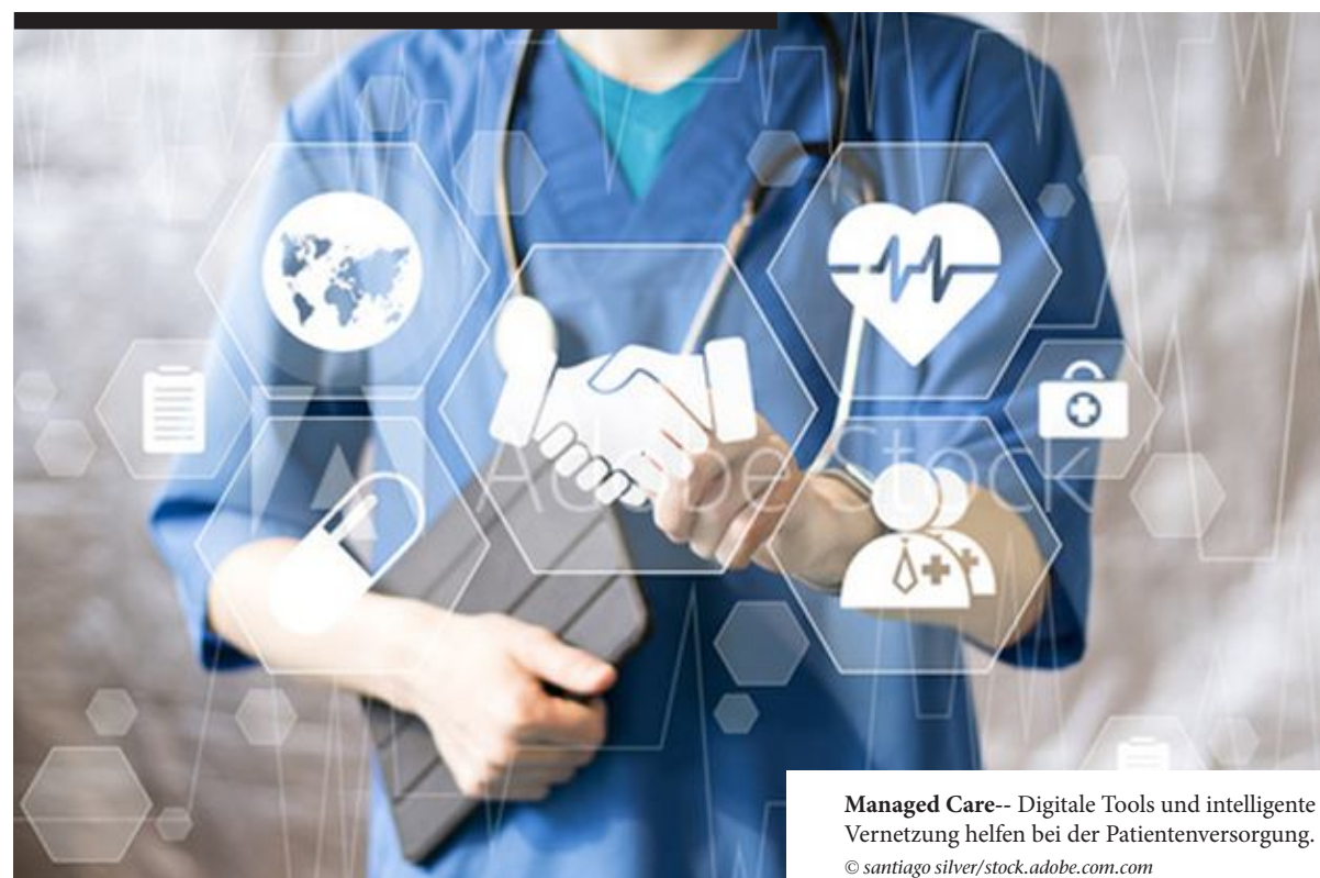
Managed Care-- Digitale Tools und intelligente Vernetzung helfen bei der Patientenversorgung.