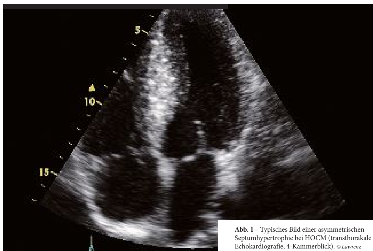
Abb. 1-- Typisches Bild einer asymmetrischen Septumhypertrophie bei HOCM (transthorakale Echokardiografie, 4-Kammerblick).