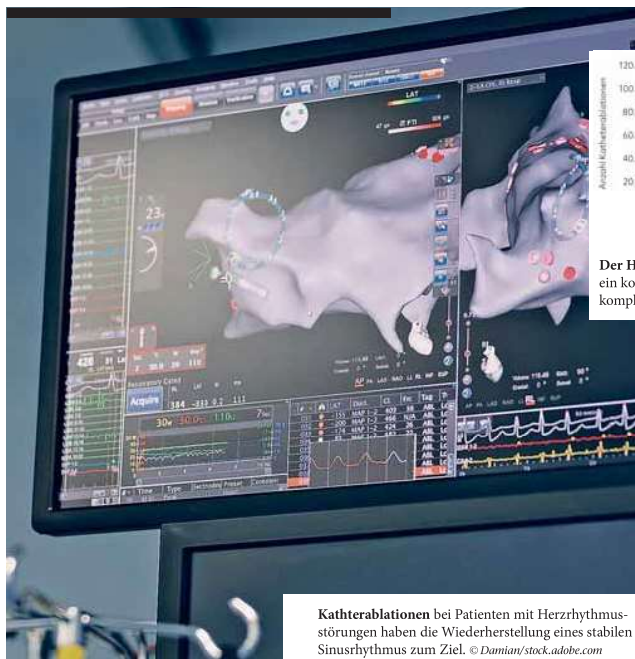
Katheterablationen bei Patienten mit Herzrhythmusstörungen haben die Wiederherstellung eines stabilen Sinusrhythmus zum Ziel.