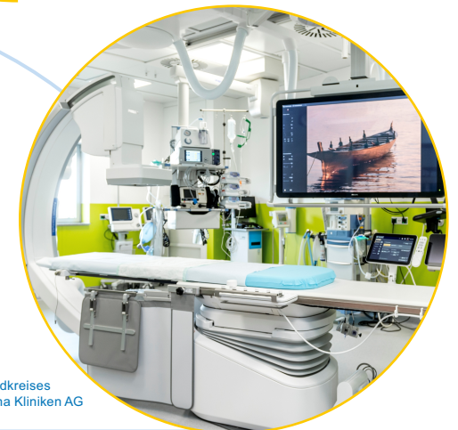
Ein Unternehmen des Landkreises Mittelsachsen und der Sana Kliniken AG